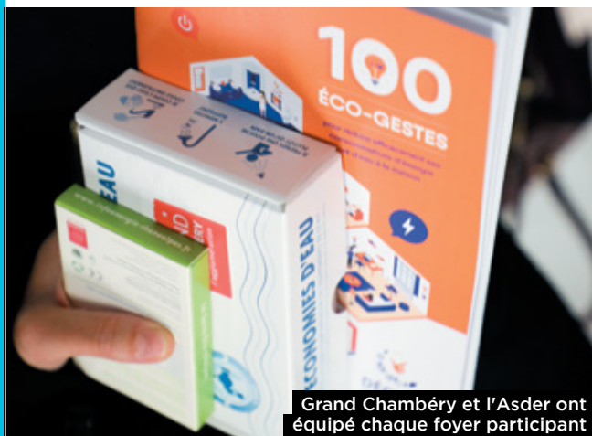
Grand Chambéry et l'Asder ont équipé chaque foyer participant d'un guide des 100 éco-gestes et d'un kit d'économies d'eau.

Ce défi s'inscrit pleinement dans la démarche du PCAET, le plan climat air énergie territorial piloté par Grand Chambéry. »