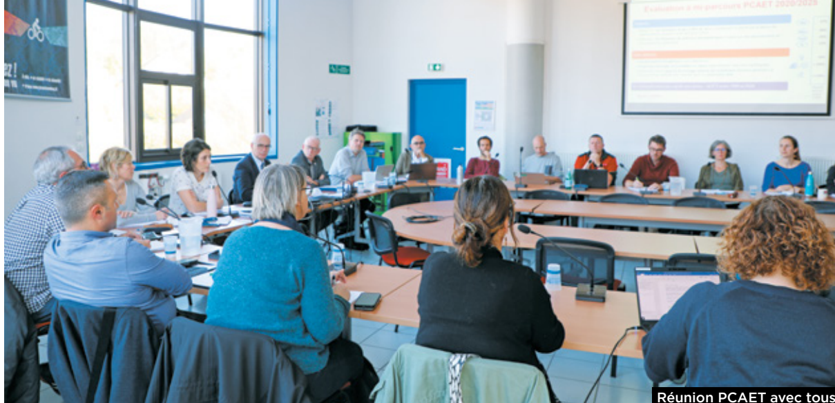
Réunion PCAET avec tous les partenaires le 8 novembre 2024.