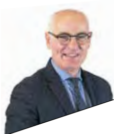
Thierry Repentin, Président de Grand Chambéry