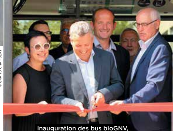
Inauguration des bus bioGNV, le 26 août.

INSCRIPTION EN LIGNE JUSQU'AU 20 OCTOBRE : www.grandchambery.fr/defi-eau-energie