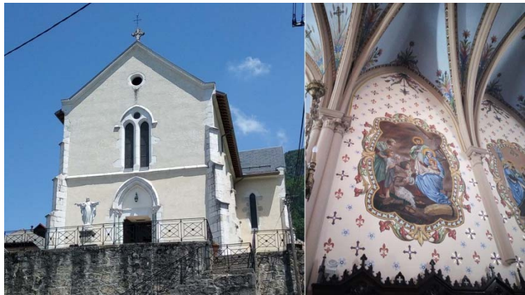
Plan de l'église et ses abords, 1875 (2M1) L'église : façade et fresques intérieures, 2018