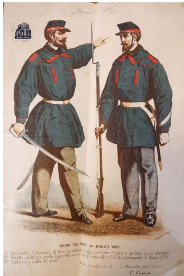
Uniforme de la garde nationale, 1859 (3H1)