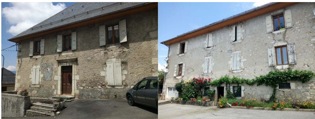
Ancien presbytère, 2018