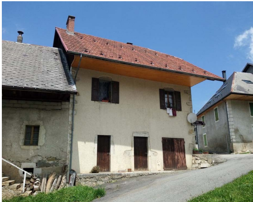
Ancienne mairie, 2018