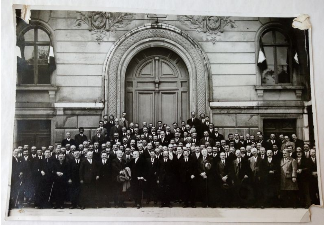
Anciens combattants de la Première Guerre mondiale devant l'hôtel de ville de Chambéry, s.d., 4H2