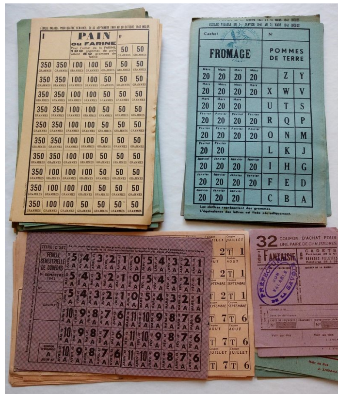
Tickets de rationnement, 1940-1941, 6F4